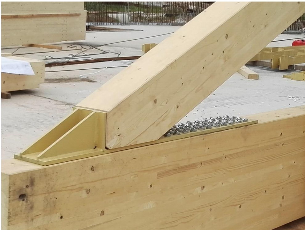
Bild 3: Anschluss der Druckstäbe der Fachwerkkonstruktion an den Untergurt mit ASSY® plus VG Schrauben in Kombination mit Winkelscheiben 45°