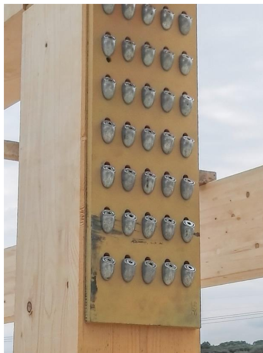
Bild 5: Anschluss der Pfosten an den Obergurt und die Druckstrebe mit ASSY® plus VG Schrauben in Kombination mit Winkelscheiben 45°

Ausführender Betrieb: Holzbau Mingolla GmbH, Binzburgerstrasse 22; D-77749 Hohberg